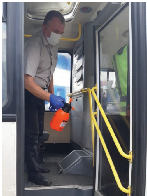
Обработка транспорта проводится несколько раз в сутки

Второе. Ограничено количество перевозимых одновременно пассажиров по карантинной норме. Рабочее место водителя в не-