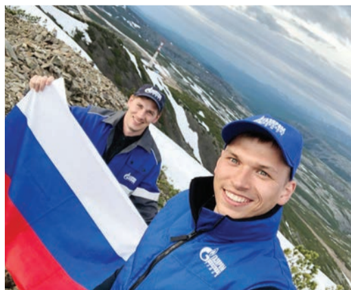
Работники Алданского ЛПУМГ

России приняли участие тысячи работников компании. Причем они подошли к этому делу творчески и с душой. Как результат – оригинальные рисунки, красиво оформленные окна, запоминающиеся фотографии. Это символ нашего единства и важный вклад в патриотическое воспитание молодежи.