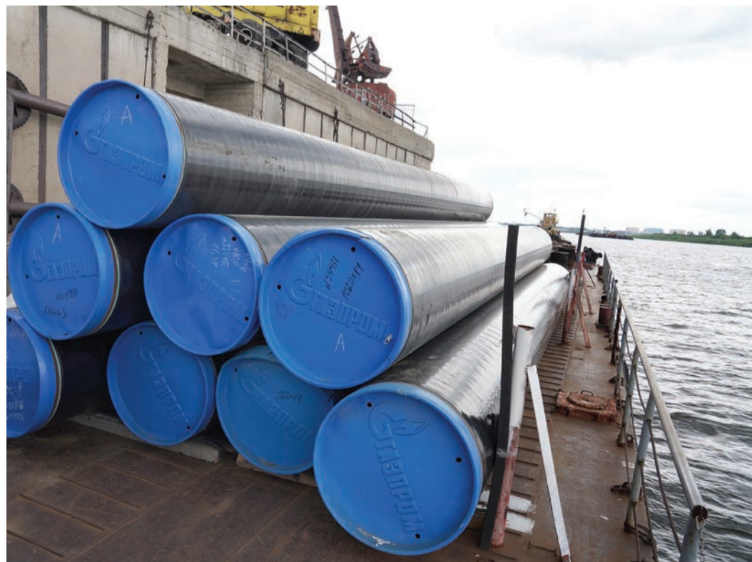
Ежегодный объем речных перевозок – более 22 тысяч тонн