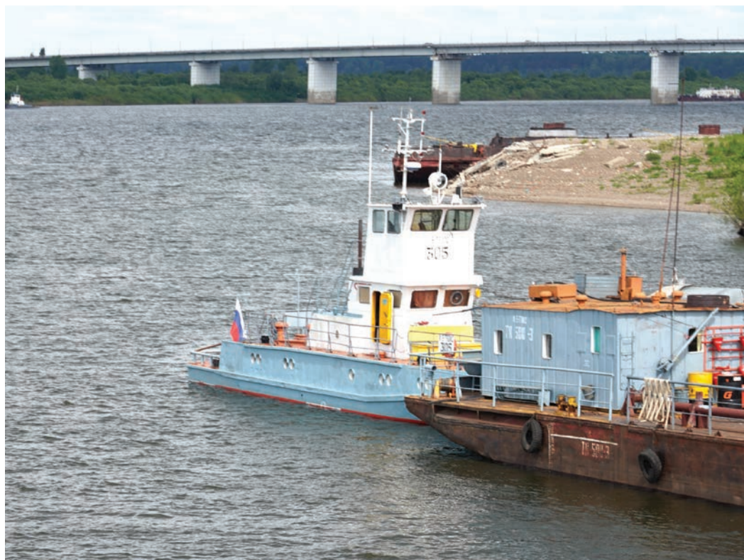
Теплоход «305» доставит на север 3500 тонн щебня и 2700 кубометров пиломатериала