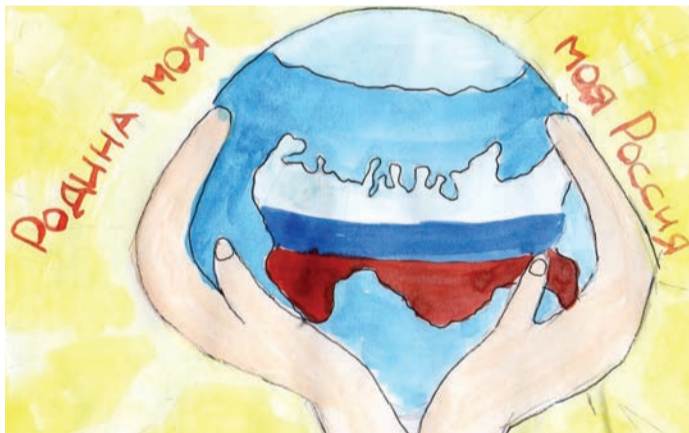
Конкурс детских рисунков в Омском филиале