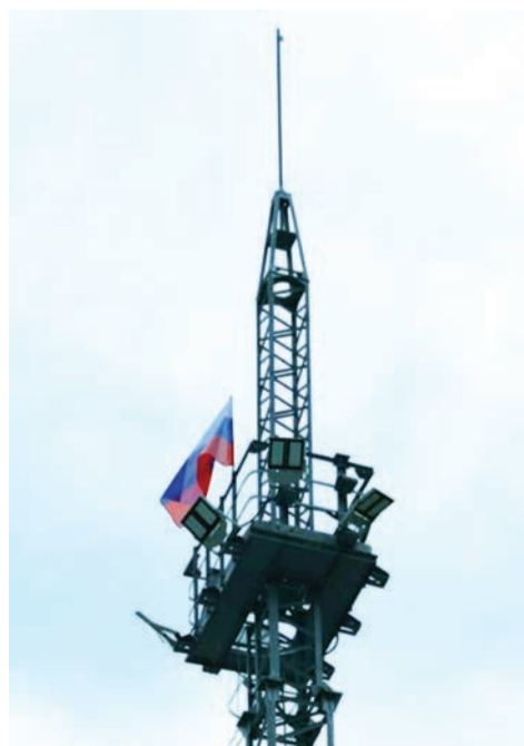
Флаг России на осветительной мачте ГРС «Уссурийск»