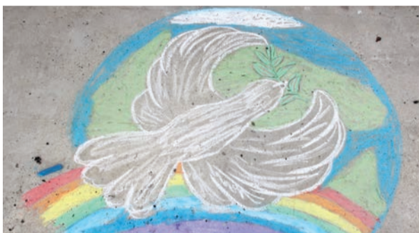
Рисунок на асфальте дочерей слесаря по контрольно-измерительным приборам и автоматике Омского ЛПУМГ Эдуарда Риттера