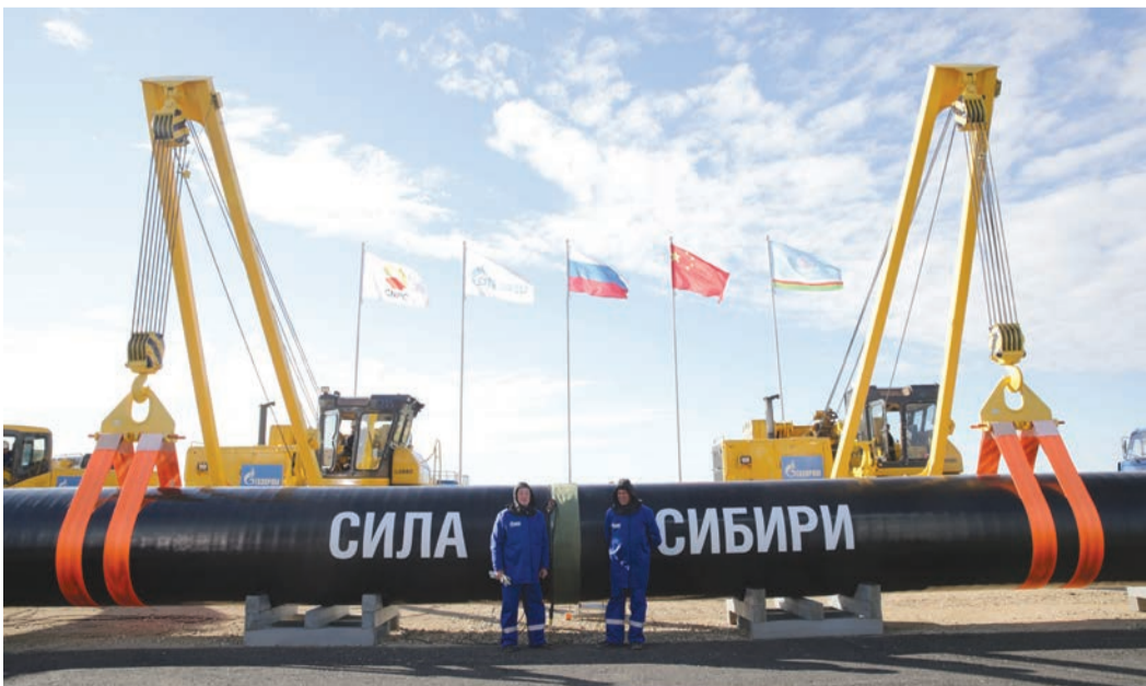
1 сентября 2014 года: сварщики Управления аварийно-восстановительных работ «Газпром трансгаз Томск» сваривали первый стык МГ «Сила Сибири»

– Самый заметный эпизод – сварка первого стыка магистрального газопровода, официальное начало грандиозной стройки. 1 сентября 2014 года навсегда вошло в историю газовой отрасли. Бригада УАВР была направлена в якутский Ус-Хатын для организации сварочно-монтажных работ. Они приняли активное участие в подготовке торжественной церемонии, где присутствовали главы двух государств – Российской Федерации и Китайской Народной Республики. Это накладывало особую ответственность на сотрудников «Газпром трансгаз Томск»: на нас смотрел весь мир.