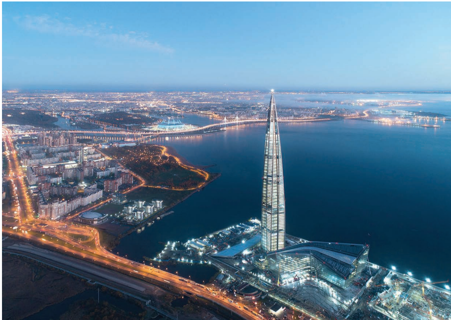
Здание ПАО «Газпром» в Санкт-Петербурге