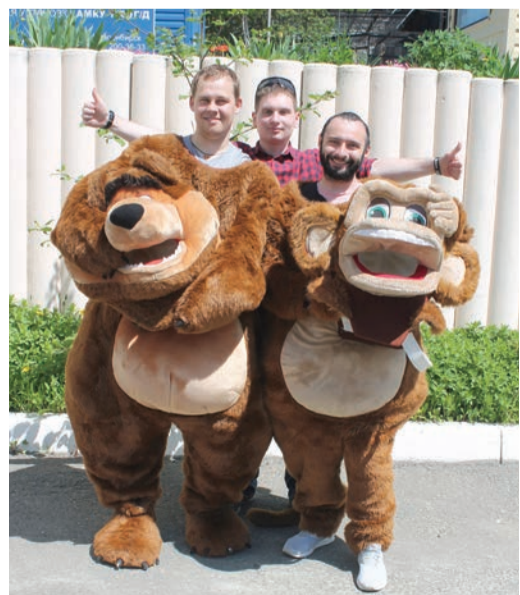
Работники Сахалинского ЛПУМТ помогли создать праздничное настроение в зоопарке

Сотрудники компании «Газпром трансгаз Томск» каждый год в преддверии Дня защиты детей проводят большое количество различных акций, ездят в гости к своим друзьям – воспитанникам подшефных детских учреждений, дарят подарки... Пандемия коронавируса не смогла прервать эту традицию. Большинство из запланированных мероприятий для детей состоялись, пусть и немного в другом формате – с соблюдением всех мер эпидемиологической безопасности.