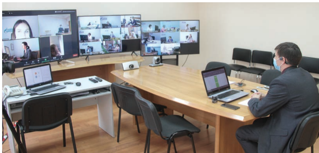
Задача куратора – следить, чтобы при тестировании никто не пользовался подсказками