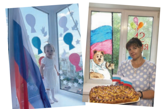
В акции #ОкнаРоссии приняли участие сотни газовиков