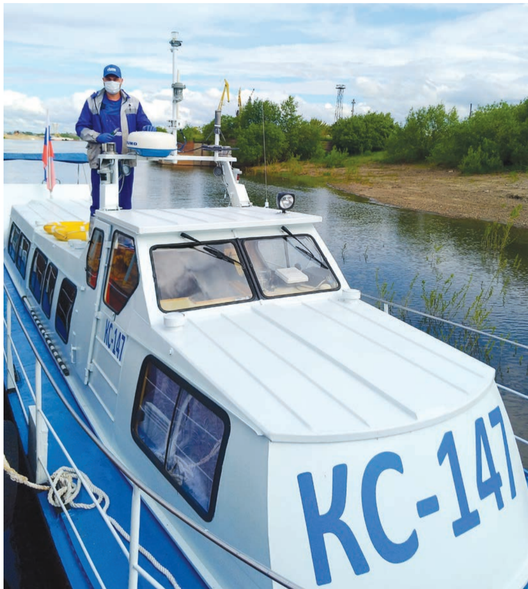
Корабли газовиков приспособлены к нраву сибирских рек