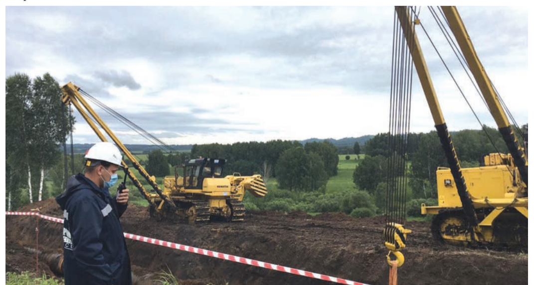
Магистральный газопровод Парабель – Кузбасс в силу своего возраста требует особого внимания