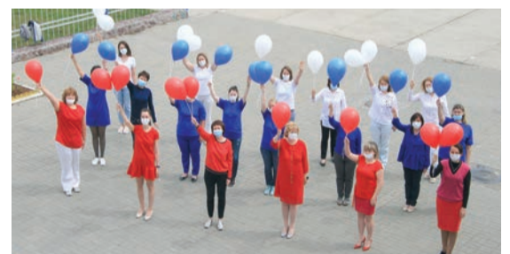
Флешмоб Алтайского филиала ООО «Газпром трансгаз Томск»