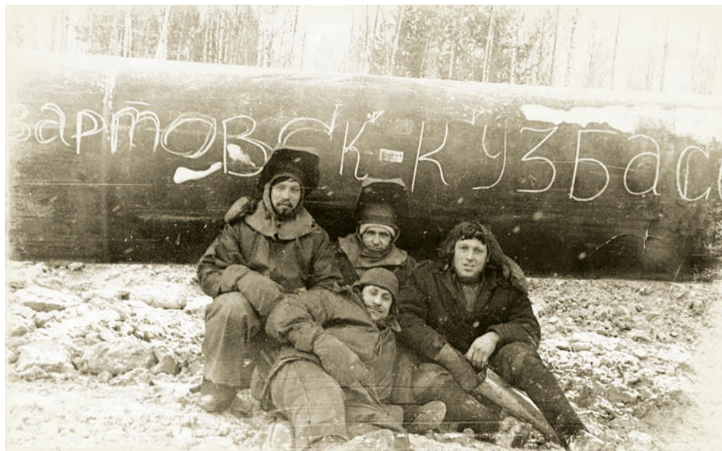
Строительство газопровода НГПЗ – ПарABELь – Кузбасс, 1970-е годы