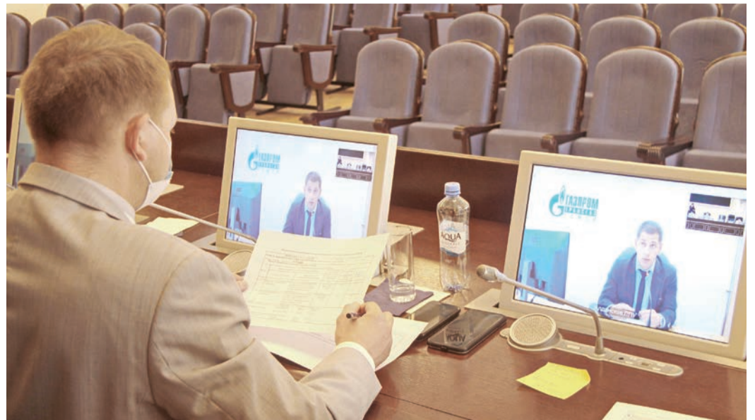
Участники конкурса «Лучший внутренний аудитор интегрированной системы менеджмента» защищали результаты внутреннего аудита ИСМ по видеоконференц-связи

Конкурсы проводятся с соблюдением всех необходимых мер предосторожности, участники выполняют задания дистанционно. К примеру, участники конкурса «Лучший молодой работник» готовили презентацию о себе и проходили спортивное тестирование. Претенденты на звание «Лучший специалист делопро-