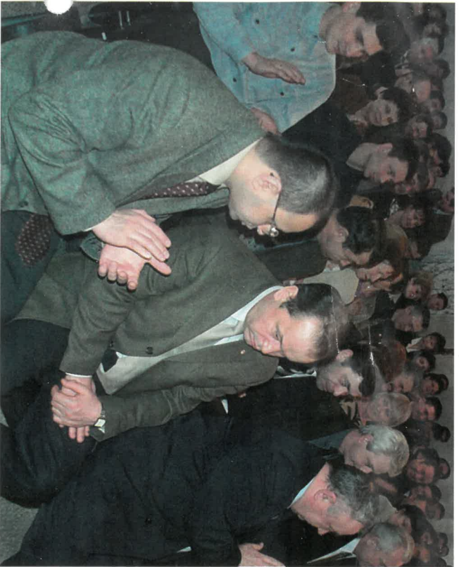
На торжественном собрании в честь 10-летия “Газпрома”