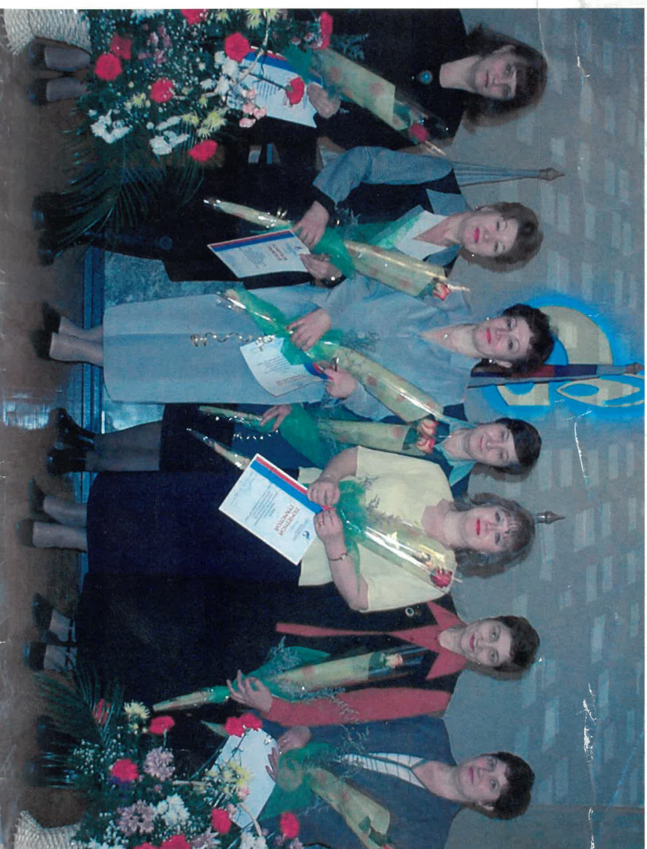
Сотрудницы предприятия, награжденные в честь 10-летия ОАО "Газпром"