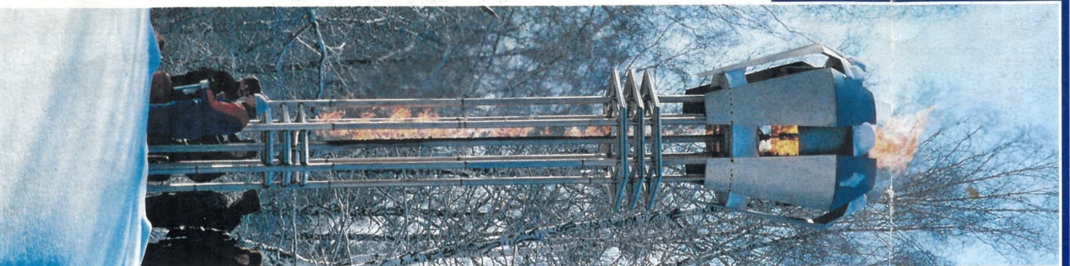
Горит огонь спартакиады