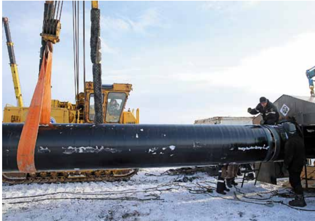
Только зимой можно провести капитальный ремонт подводного перехода через Обь