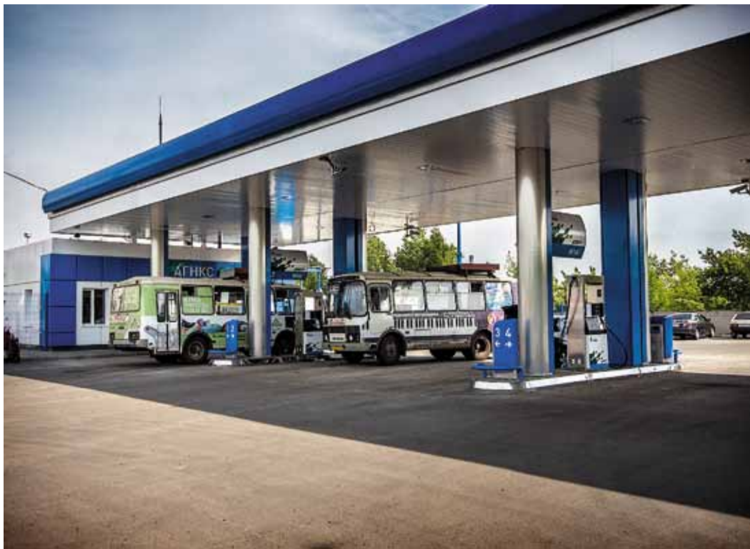
Транспорт, использующий метан, становится привычным на наших улицах