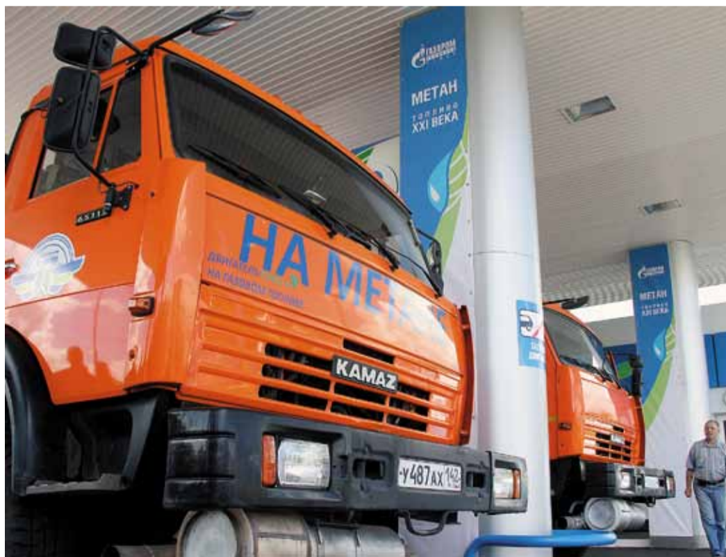
Неоспоримые плюсы от использования метана – экология и экономия

Второе место поделили два коллектива – Кемеровское и Барабинское ЛПУМГ. Третье место занял кабинет Управления технологического транспорта и специальной техники.