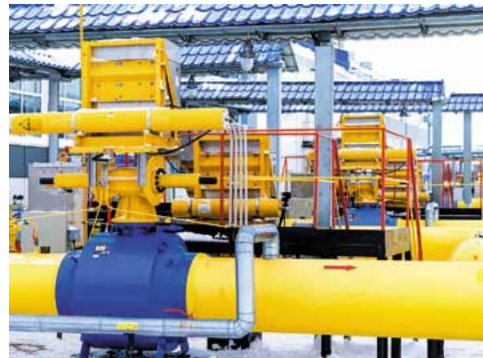
Компрессорная станция «Парабель» стала первой на МГ Парабель – Кузбасс