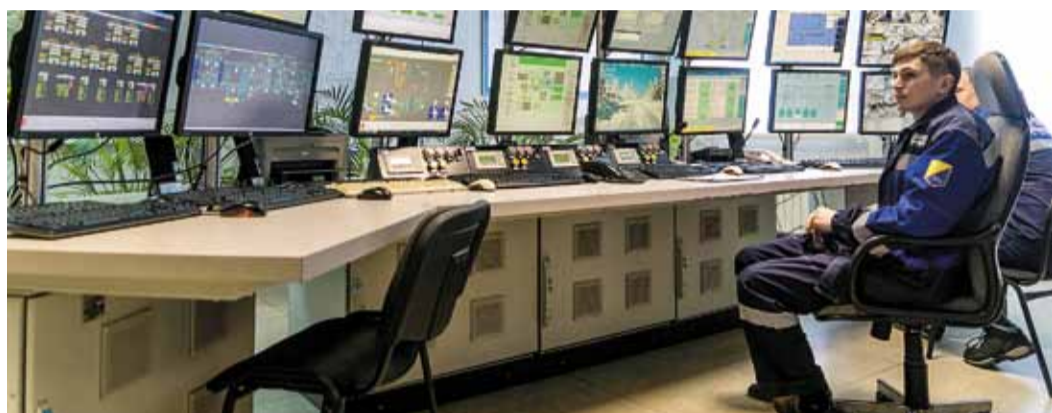
Диспетчеры КС «Парабель» в режиме онлайн могут следить за всеми процессами на станции