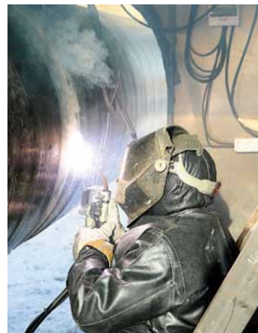
В ходе капитального ремонта используется современная технология полуавтоматической сварки