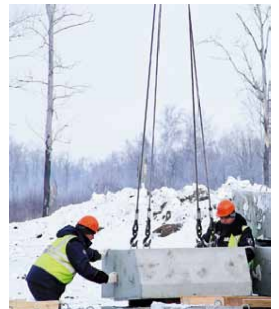
Болотные утяжелители – одно из условий надёжной работы подводного перехода