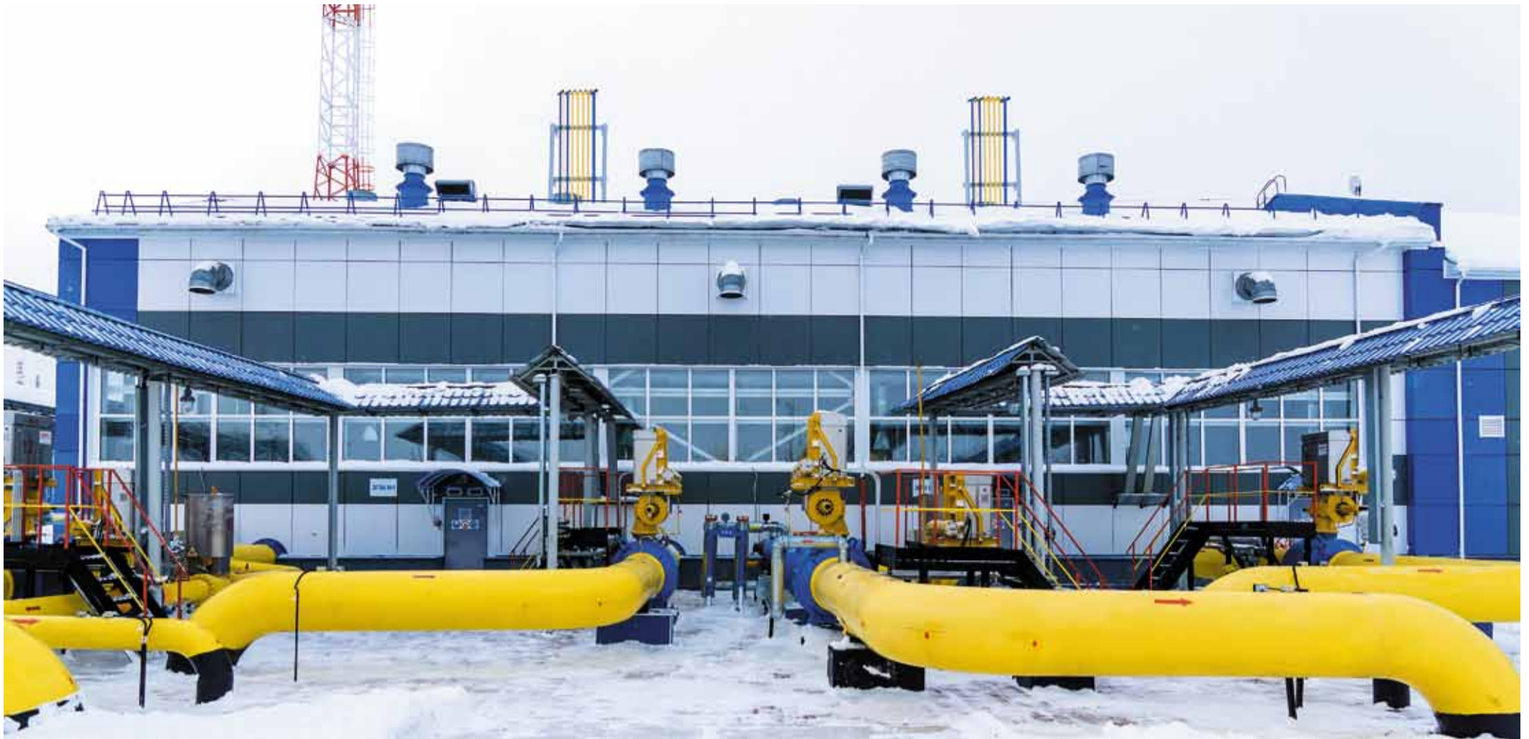
За год КС «Парабель» перекачивает около 15–16 млрд кубометров газа