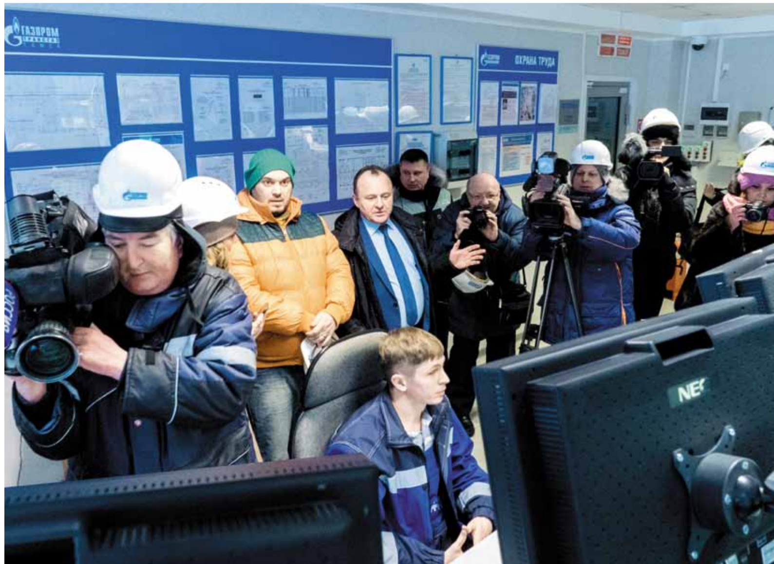
Более двадцати журналистов посетили в рамках пресс-тура Парабельскую промплощадку Томского ЛПУМГ. Материал об этом на стр. 4 и 5