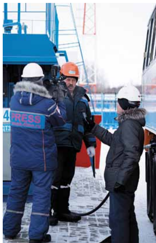
На Парабельской промплощадке реализован проект по автоматизированному наливу и учету топлива

В силу своего географического положения Парабельский район – один из ключевых на карте производственной деятельности ООО «Газпром трансгаз Томск». Сорок лет назад именно по его территории пролегла