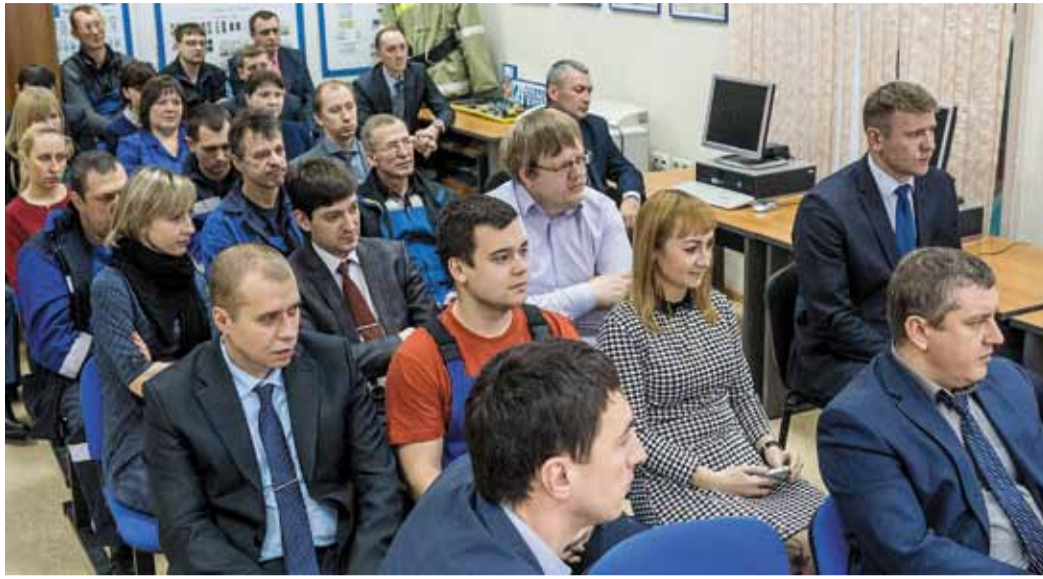
Работники филиалов могли смотреть трансляцию конференции в режиме реального времени

С одной стороны, 82 человека из нашего ближнего круга получили помощь, а с другой стороны, три работника Общества, которые не приобрели страховку, обратились к руководству компании за помощью только в тот момент, когда возник несчастный случай. Они сожалели: им помогли только советом, потому что год назад были приняты правила о том, что за здоровье своих близких работник отвечает сам, и 1300 со-