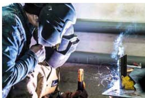
Подаренные газовиками костюмы сварщиков помогают молодёжи получить навыки профессии в местном техникуме