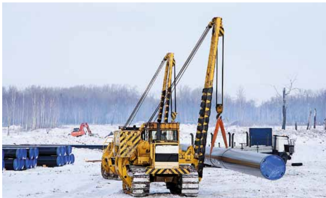
На трубосварочной базе

Подводный переход – участок особой категоричности. Как и переходам через тектонические разломы, этим местам уделяется особое внимание. Фактор риска для газовой магистрали здесь на порядок выше, чем на равнинном сухопутном участке. Во-первых, вода – это действительно стихия. Старожилы «Томсктрансгаза» помнят, как 30 лет назад наводнение смыло здесь пойменную часть перехода, опрокинуло пригрузы – и труба, находясь под давлением, всплыла.