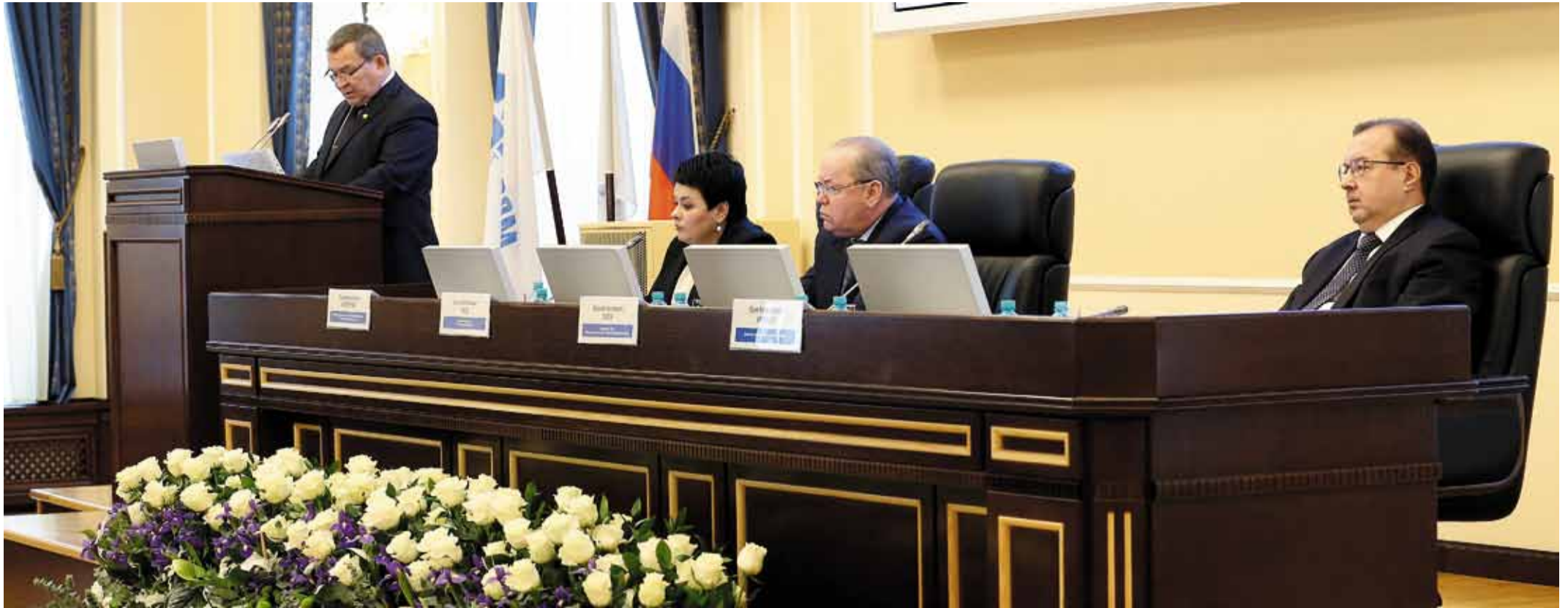
Коллективный договор – это важнейший документ для всех, кто работает в Газпроме