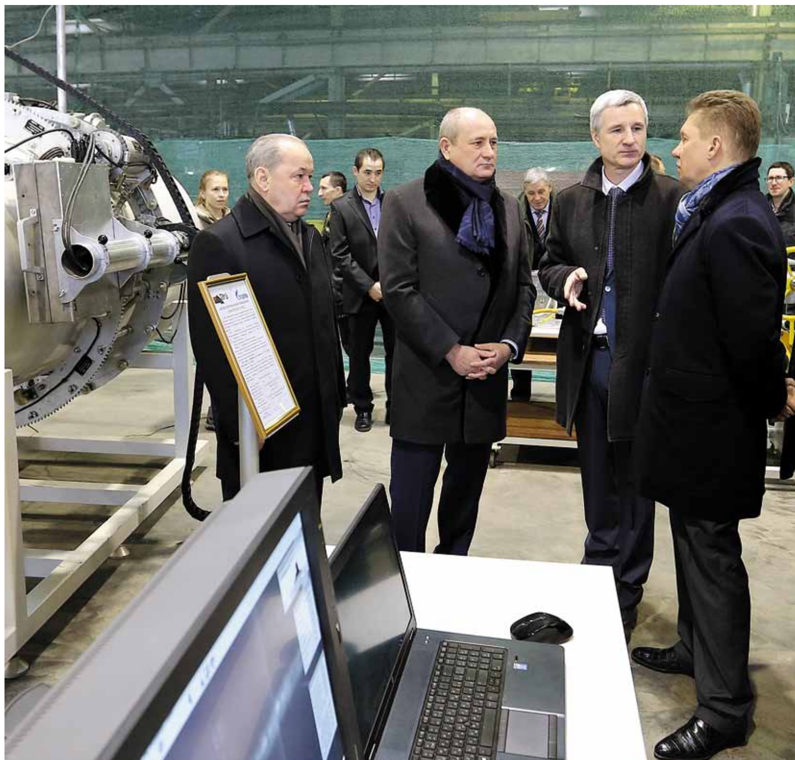
Председатель Правления Алексей Миллер на выставке продукции томских производителей