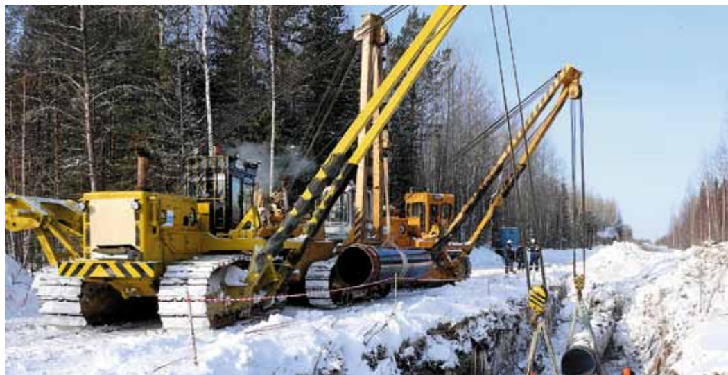
28 единиц техники задействовано на участке 383–410 километр МГ НГПЗ – Парабель

На Парабельской промплощадке Томского ЛПУМГ ООО «Газпром трансгаз Томск» ведётся текущий ремонт по устранению дефектов, выявленных в результате внутритрубной дефектоскопии, на участках магистральных газопроводов НГПЗ – Парабель и Парабель – Кузбасс.