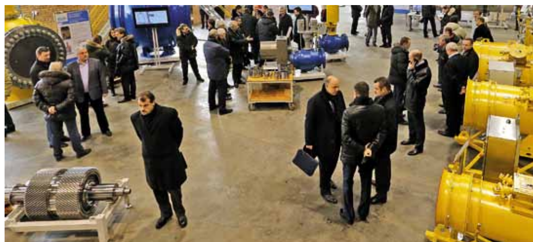
Томские промышленники представили широкий спектр продукции

Теперь такая позиция и у Газпрома. И объясняется она не только государственной экономией, но и отстаиванием собственного, российского «я» на мировом уровне.