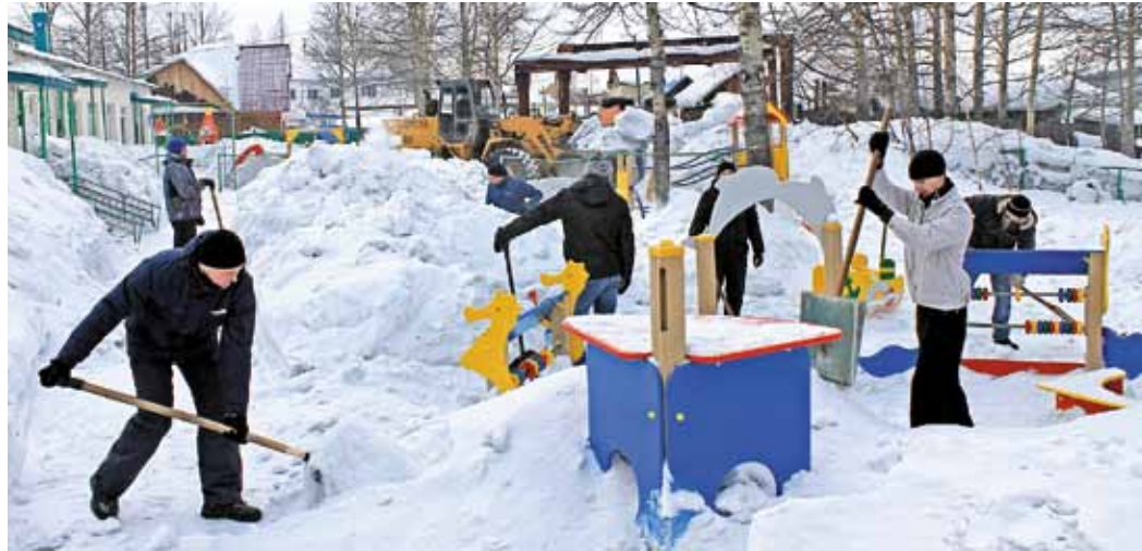
Первая благотворительная акция алданских газовиков

Если в Томске снежными зимами бывают не всегда, то на Сахалине обильные снегопады – это часть повседневной жизни островитян. Уже не первый год коллектив Сахалинского ЛПУМТ помогает администрациям населенных пунктов справиться со снеж-