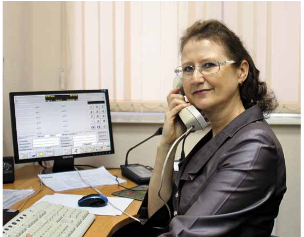
Когда работа в радость!

— Иду как-то утром на работу — подходит служебный автобус. Захожу в него, хочу поздороваться и говорю: «Пятая», доброе утро!» — в ответ все как захотели! До сих пор смешно вспоминать эту забавную историю. Такое, кстати, иногда и дома бывает. Вот зво-