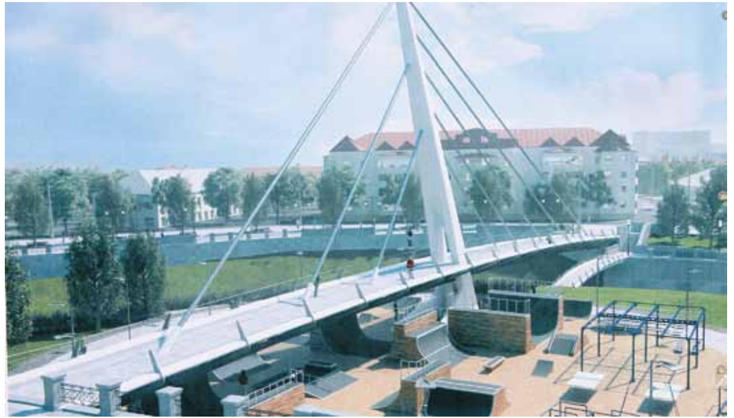
По проекту через Ушайку будет построен новый мост и создан спортивный парк

– Мы строили здания, развивали транспортную инфраструктуру, но на обустройство берегов Ушайки десятилетиями закрывали глаза. Я уверен, что современная набережная в центре города – это то, чего не хватало томичам, – подчеркнул губернатор Сергей Жвачкин, сказав, что все строительные работы будут завершены до 2017 года.