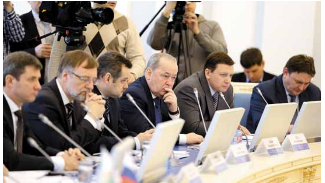
Газпром и томские предприятия сформировали перечень из 50 видов продукции, актуальных для газовой отрасли

В проектную документацию магистрально-газопровода «Сила Сибири» включена сле-