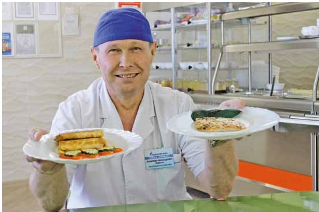
Обед от Сан Саныча – красиво и вкусно!

В декабре прошлого года после капитального ремонта радушно распахнула двери обновленная столовая Кемеровского ЛПУМГ. Открывали столовую торжественно, ведь это событие стало долгожданным и для коллектива, который шесть месяцев питался в полевом вагоне-столовой «Ермак», и для поваров, которые в таких достаточно стесненных условиях должны были готовить для 150 сотрудников. И они не подкачали, готовили, как всегда, вкусно и разнообразно.