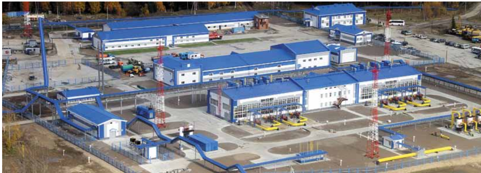
В каждую реконструированную компрессорную станцию внесли свой вклад инженеры ИТЦ