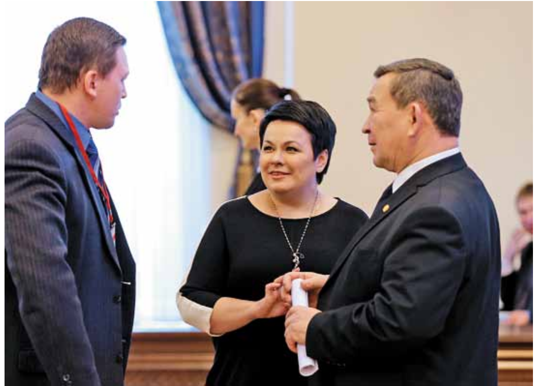
Коллективный договор компании – честное партнёрство работодателя и профсоюза

Впрочем, почувствовать на себе силу и заботу профсоюзов смогли и те, кто об этом, может, и не задумывался. В мае на Алтае случилось наводнение, из берегов вышло пять крупных связанных между собой рек. В числе пострадавших от стихии оказались работники Алтайского ЛПУМГ. Им была оказана материальная помощь Администрацией Общества совместно с первичной ПО. С одной стороны, пришла беда, которой не ждали,