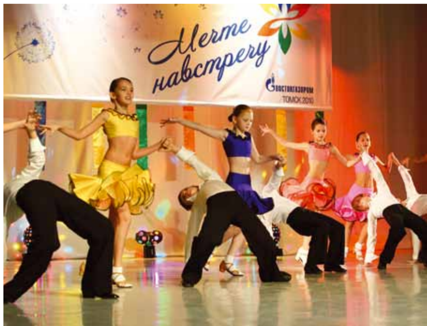
Ансамбль «Карусель». Танец «Яблочко»

Команда Востокгазпрома уверена: у нас есть все для победы. Главное – упорство и желание двигаться вперед к новым творческим победам!