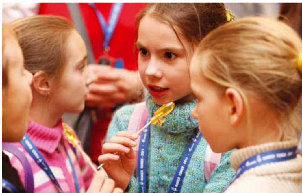
...Мы делили леденец...