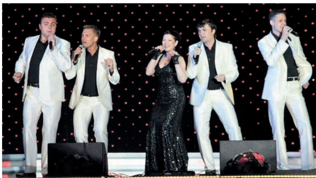
Вокальная группа «ПРЕМЬЕР» – 2 место в вокале эстрадном (ансамбль)