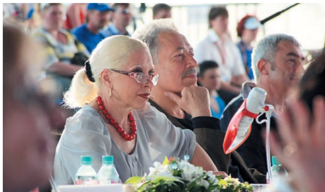
Напряжённая работа членов жюри. Сложно выбрать из такого многообразия талантливых артистов лучшие коллективы и лучших исполнителей