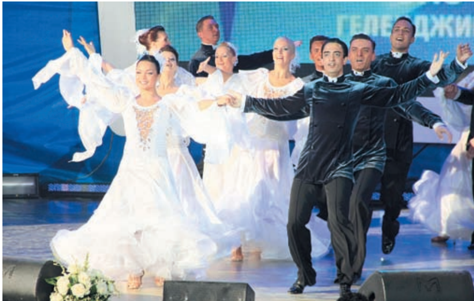
Танцевальный коллектив «МУЗЫКА СЕРДЦА» – 1 место в хореографии бальной (ансамбль)