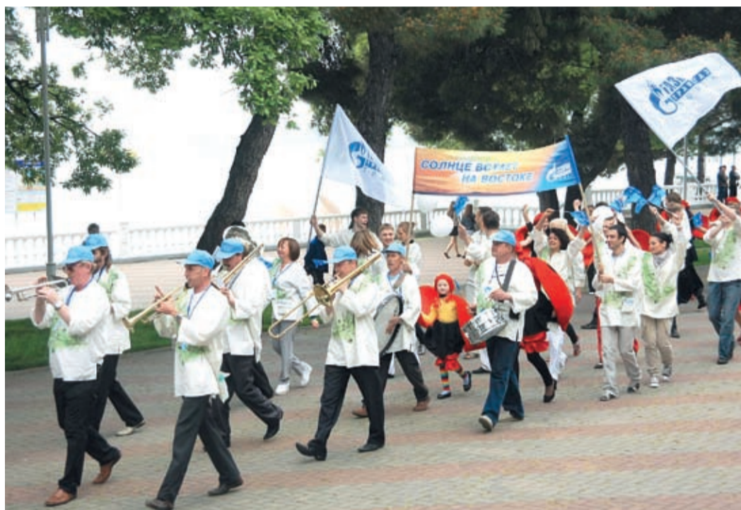
– Главное, ребята, сердцем не стареть! – знакомая мелодия в исполнении духового оркестра далеко опережала карнавальную колонну томской команды