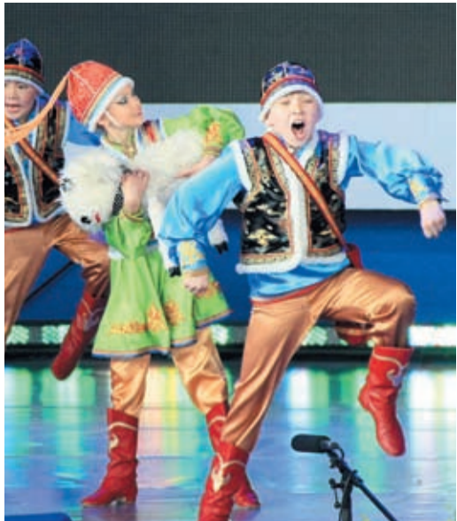
Театр танца «АЛТАМ» занял 1 место в хореографии народной