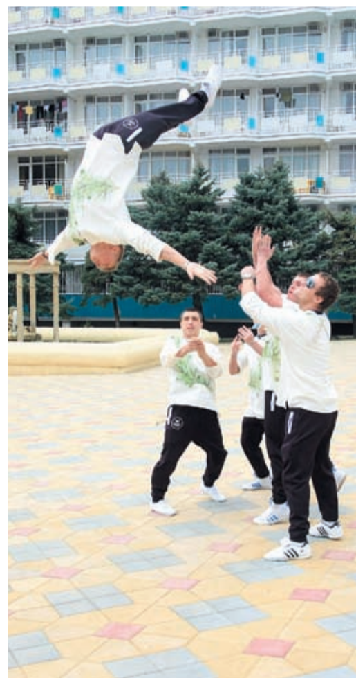
Ребята из команды «ЮДИ» умеют летать