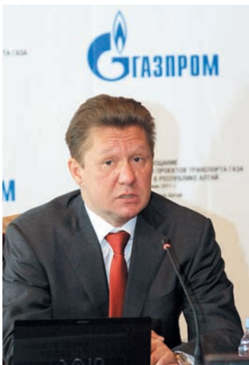
«Газпром и правительство Республики Алтай на 100% выполняют график синхронизации», – подчеркнул, открывая совещание, Алексей Миллер

– Мы продолжим строительство магистральных газопроводов на Алтае. В текущем году в планах начало работ по строительству газопровода от газораспределительной станции «Алтайская» до Нижней Каянчи. Мы также работаем над строительством магистрального газопровода на юго-западе Алтайского края, в направлении села Ребриха.