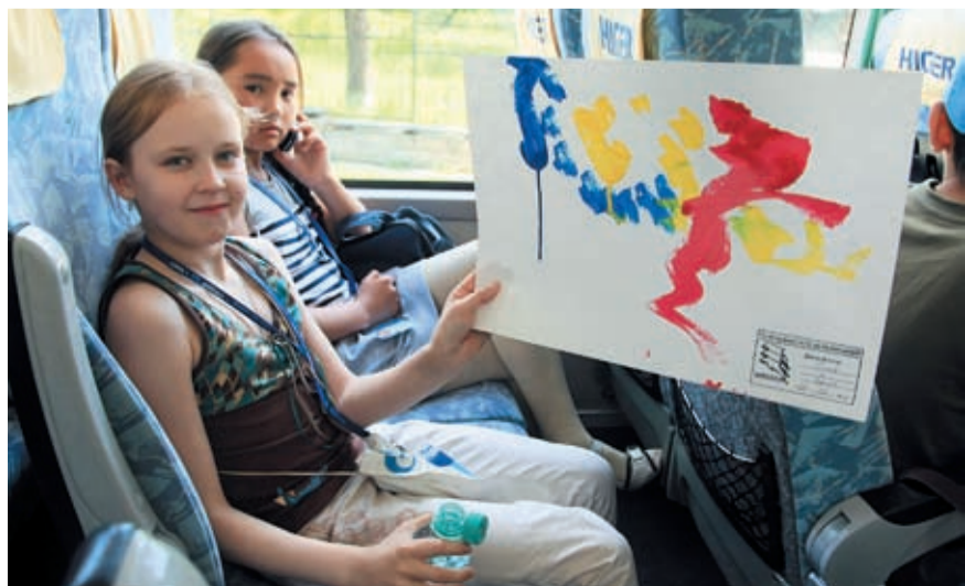
Эту картину нарисовал дельфин