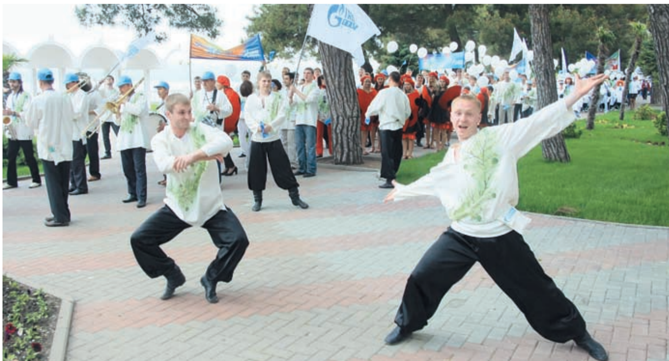
При остановках карнавальная колонна то и дело вспыхивали спонтанные танцевальные сэйшны