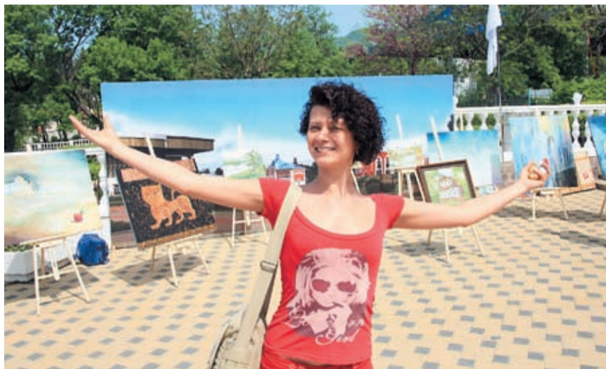
Здравствуй, Томск! Мы тебя любим!