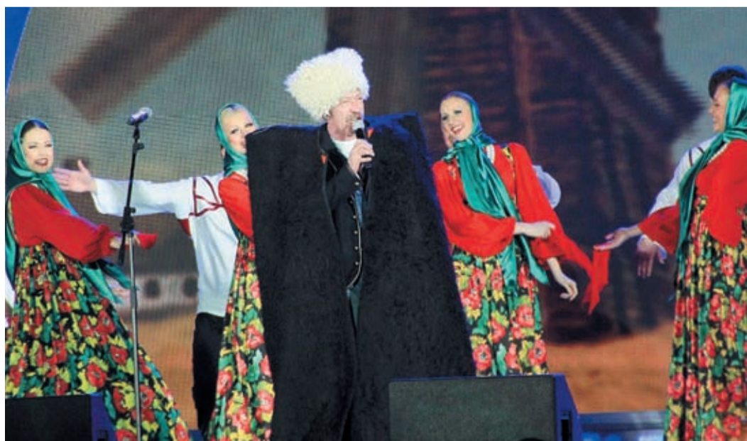
Народный артист России Александр Розенбаум неожиданно выступил на открытии фестиваля вместе с Государственным русским народным хором имени Пятницкого

В этот раз на фестивале прошли презентации тех городов, которые становились столицами зональных туров «Факела». Команда «Газпром трансгаз Томск» представляла город Томск.