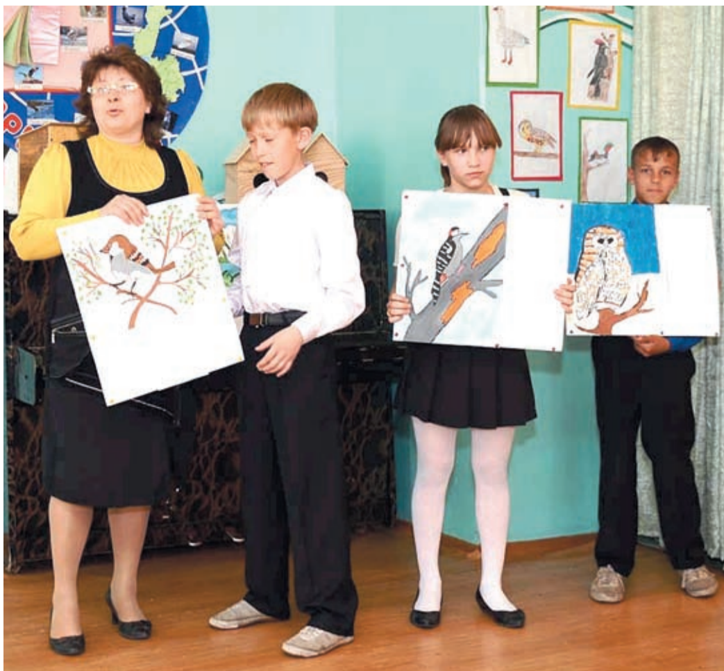
В ходе экологической познавательной акции ребята узнали много нового о пернатых жителях земли, постарались как можно разнообразнее рассказать о птицах

Каждая группа была неповторима в своей изобретательности. Ребята из пятой группы самостоятельно подготовили видеопрезентацию, рассказали о дикуше, колпице, ибисе, кречете и других птицах. Дети вместе с воспитателями удивили зрителей эссе-наблюдением «Птицы очень похожи на людей». Оказывает-