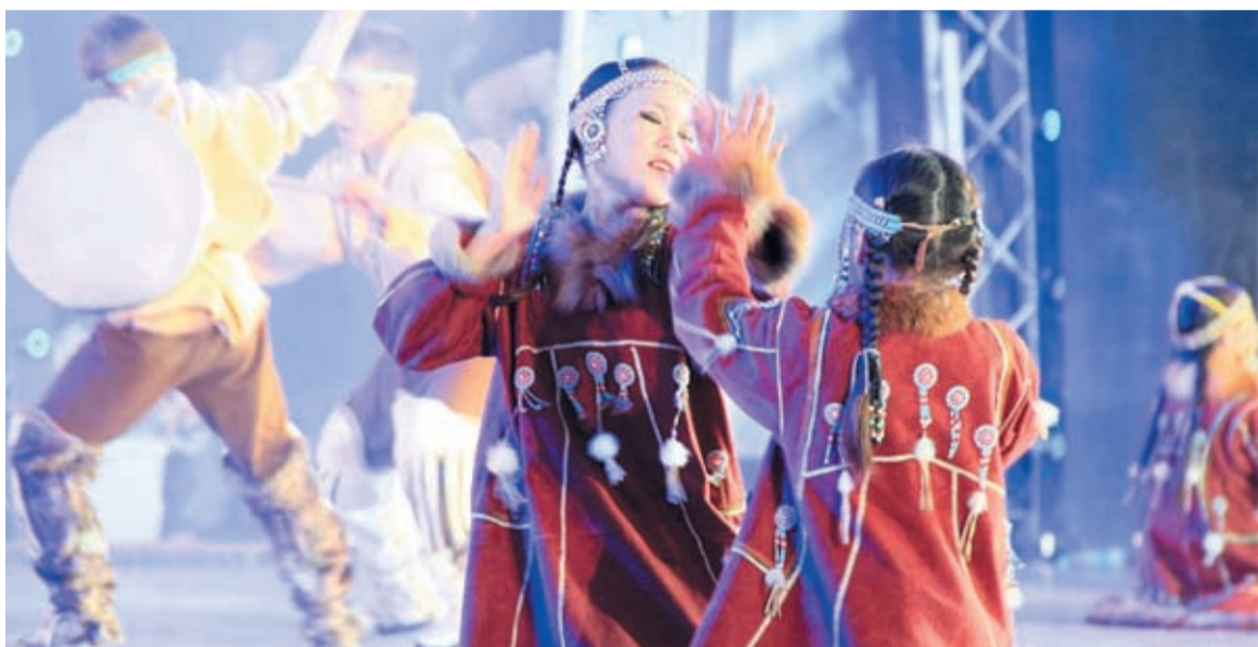
Детский эвенский народный ансамбль «ОРЬЯКАН» – 1 место в фольклоре