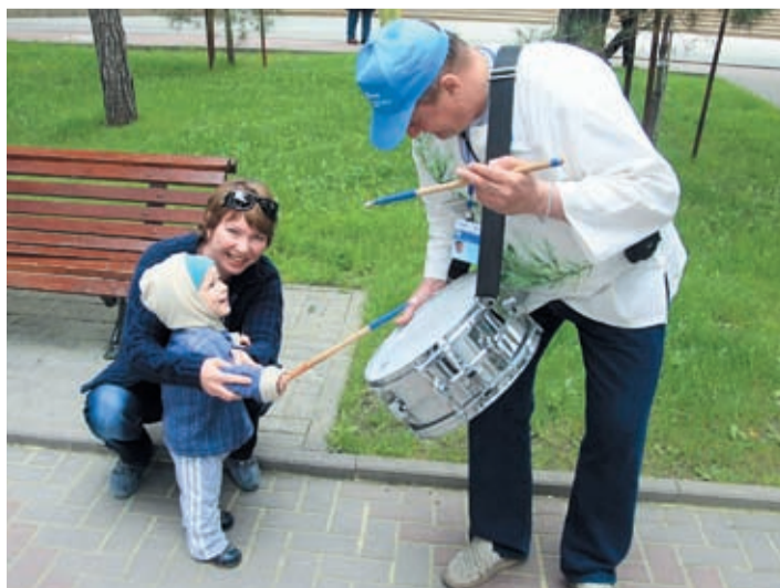
Когда я вырасту, тоже научусь играть на барабанах