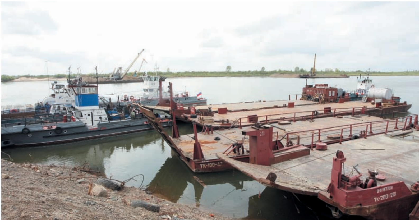
Весной, по большой воде, газовики по максимуму используют самый экономичный водный транспорт

В жилом комплексе закончена облицовка зданий. Все они обшиты современным сайдинговым материалом. Рабочие бригады отделочников заняты внутренним благоустройством помещений. В местах, предусмотренных проектом, устанавливаются гипсокартонные перегородки. Ведется наклейка обоев, покраска стен и полов. Заканчивается монтаж систем отопления и приточно-вытяжной вентиляции. В общей сложности на стройке занято 70 строителей. Это количество специалистов должно быстро справиться с оставшимся фронтом работ. Сдача объекта намечена