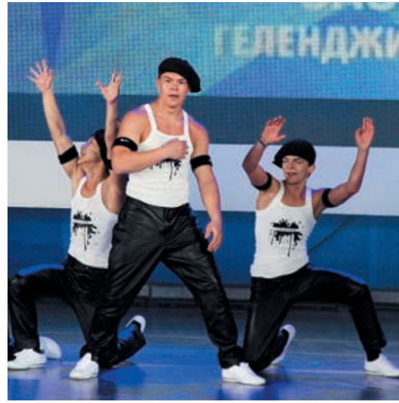
Школа-студия «ЮДИ» – 2 место в эстрадно-цирковом и оригинальном жанре