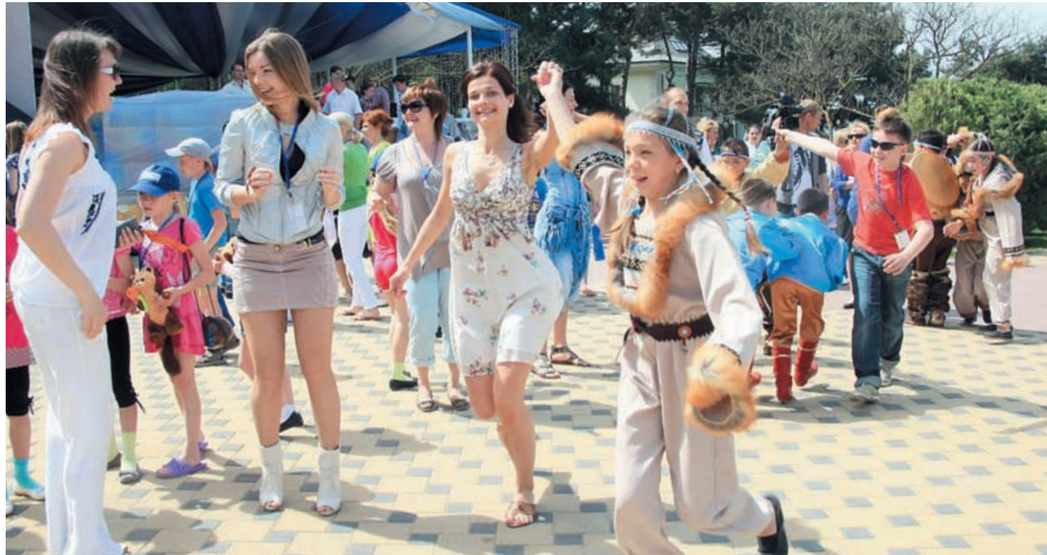
На Дне города Томска было весело всем: и детям, и взрослым