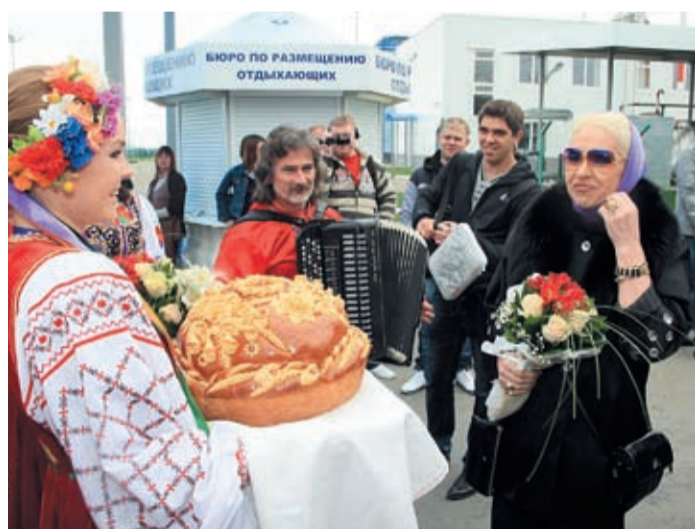
Встреча в аэропорту: по-кубански горячо