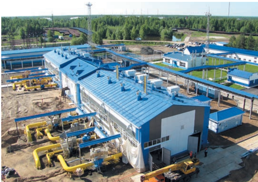
КС «Парабель» в завершающей стадии реконструкции

В Юргинском филиале компании «Газпром трансгаз Томск» готовятся к реконструкции компрессорной станции «Проскоково».