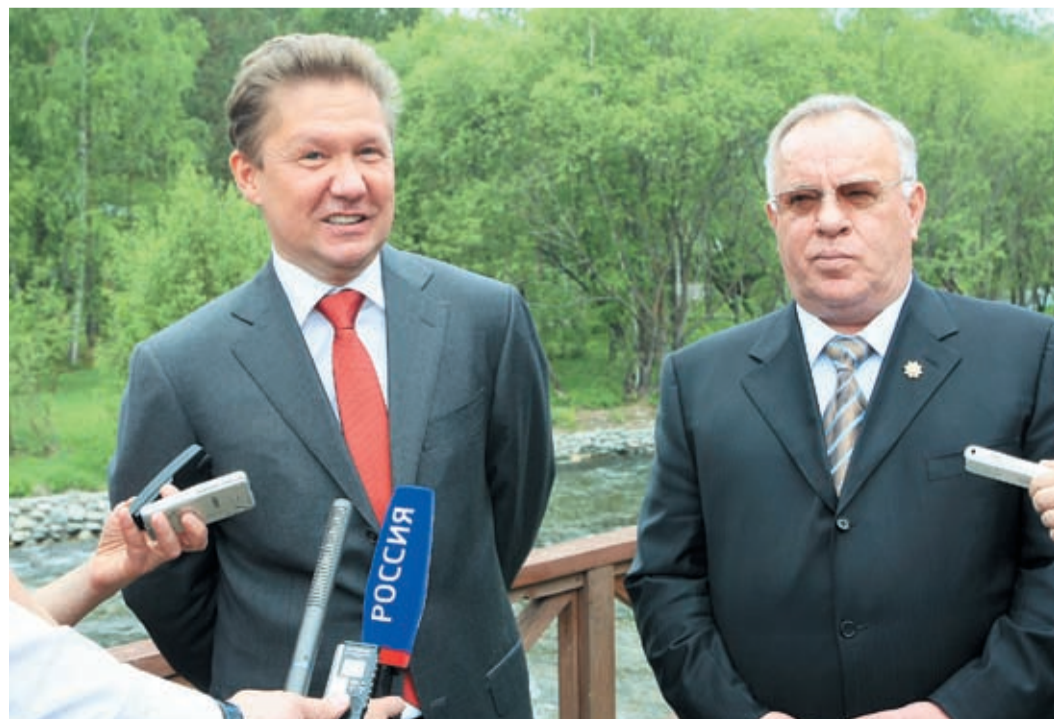
Алексей Миллер: «Республика Алтай является стратегически важным партнером Газпрома»