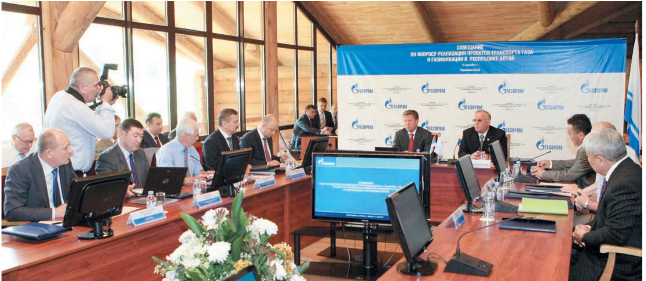
Совещание по вопросам реализации проектов транспортировки газа и газификации в Республике Алтай