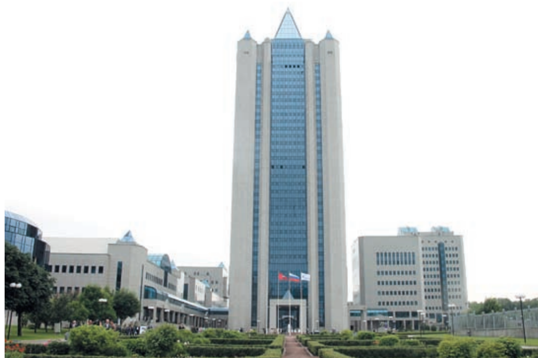
Центральный офис ОАО «Газпром»

Соглашение о сотрудничестве между ОАО «Газпром» и Администрацией Алтайского края было заключено в 2004 году и пролон-