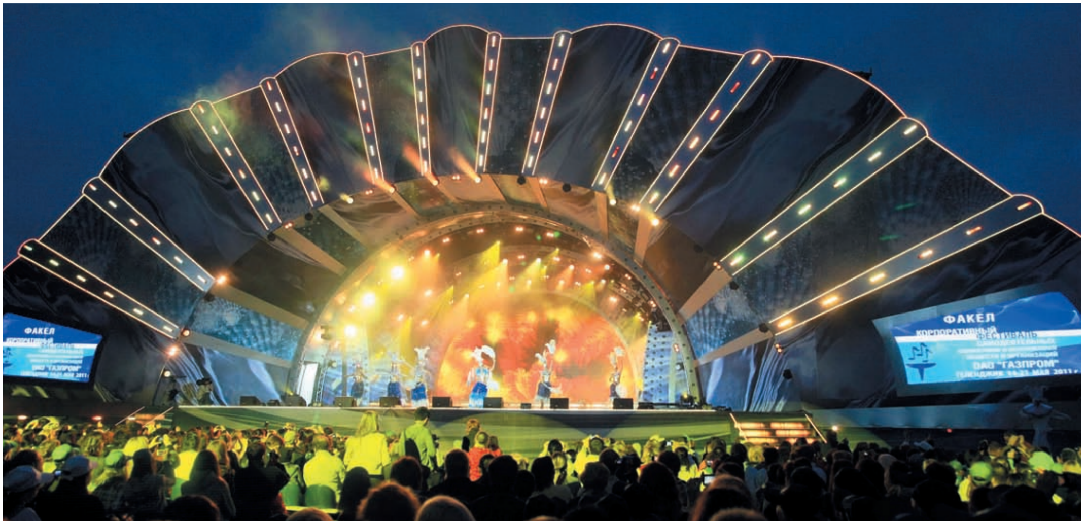
Сцена – фантастическая ракушка – бесценный подарок организаторов участникам фестиваля «Факел»

Гран-при фестиваля, 6 первых мест и 5 вторых – таков итог выступления команды «Газпром трансгаз Томск», собравшей лучшие творческие коллективы Сибири и Дальнего Востока, на корпоративном фестивале Газпрома «Факел» в Геленджике.