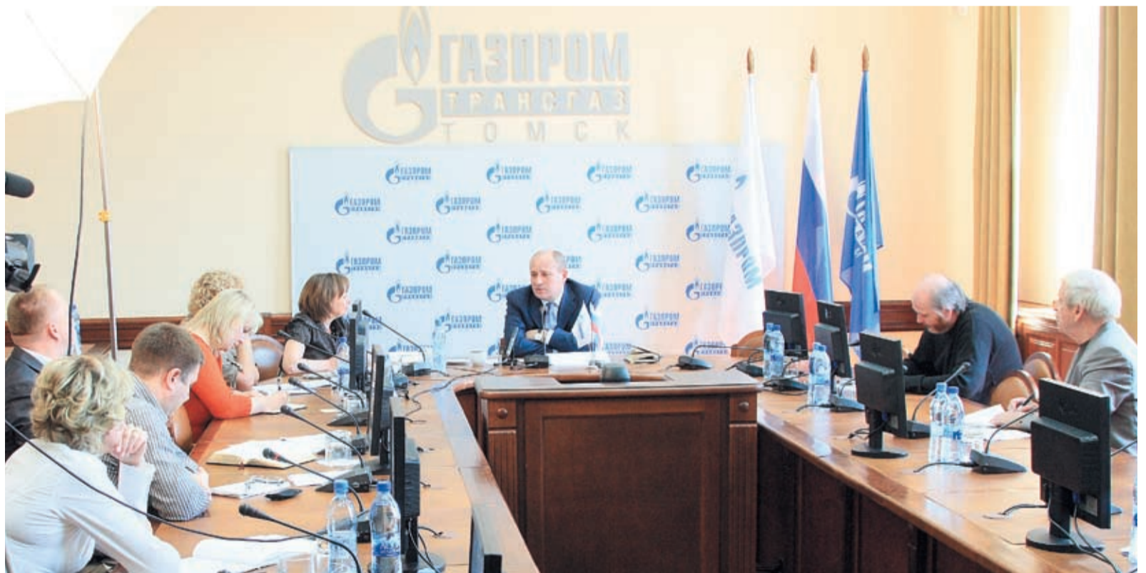
Томских и региональных журналистов интересовали все сферы деятельности предприятия, от производства, модернизации, внедрения новых технологий и подбора персонала до социальной работы Общества. Особенно актуальными были вопросы, касающиеся «прихода газа» в регионы Дальнего Востока

Второй момент. Газ – это высокотехнологичное топливо. Он требует минимум затрат для производства энергии. Значит, это должно повлиять и на снижение энерготарифов.