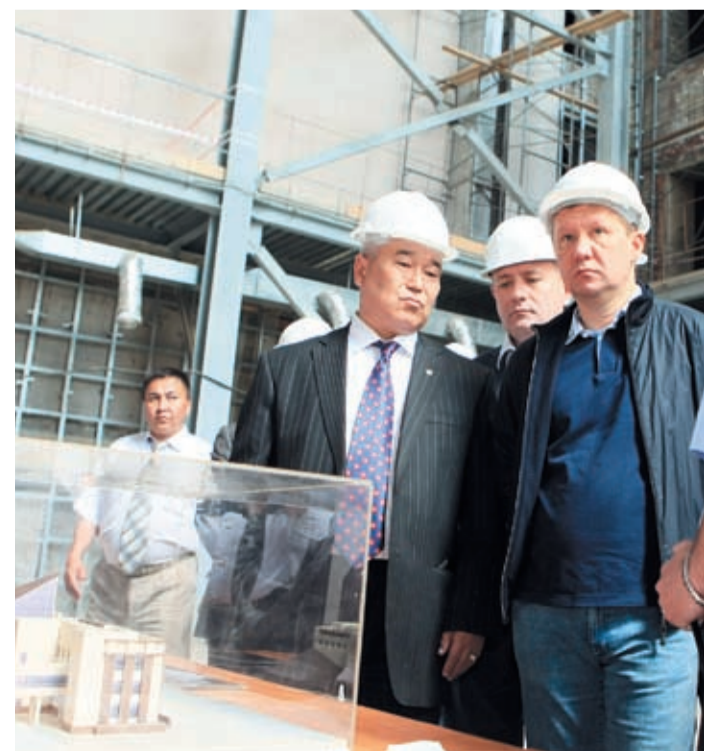
Осмотр реконструируемого на средства ОАО «Газпром» Национального музея в Горно-Алтайске